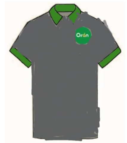
Chomba para Serenos, Defensa Civil y Puesto de Control.